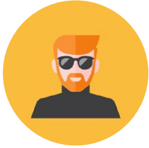
Walter Webber / Experte rund ums Web

Aufgabe zum Clip Talk, Talk, Talk: Wer hat welchen Standpunkt? Beschreibe die Ansichten der unterschiedlichen Talkshow-Gäste mit deinen eigenen Worten.